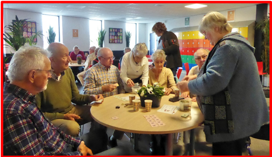
De lootjes vonden gretig aftek.