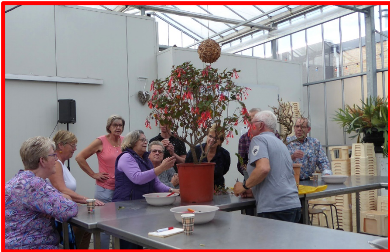
Deze grote plant ging ook kort gesnoeid mee terug naar huis.