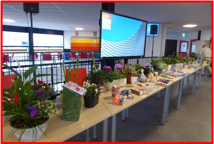
Er was weer een goed gevulde tafel voor de loterij.