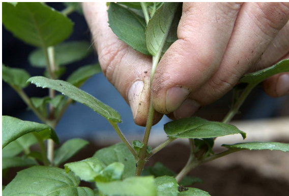
Als je de top verwijdert krijg je meer zijtakken.

Mocht u de wedstrijdstek nog niet hebben gekregen, dan kunt u deze op deze middag meenemen. Ook kunt u hier mest kopen om weer mooie bloeiende planten te krijgen deze zomer.